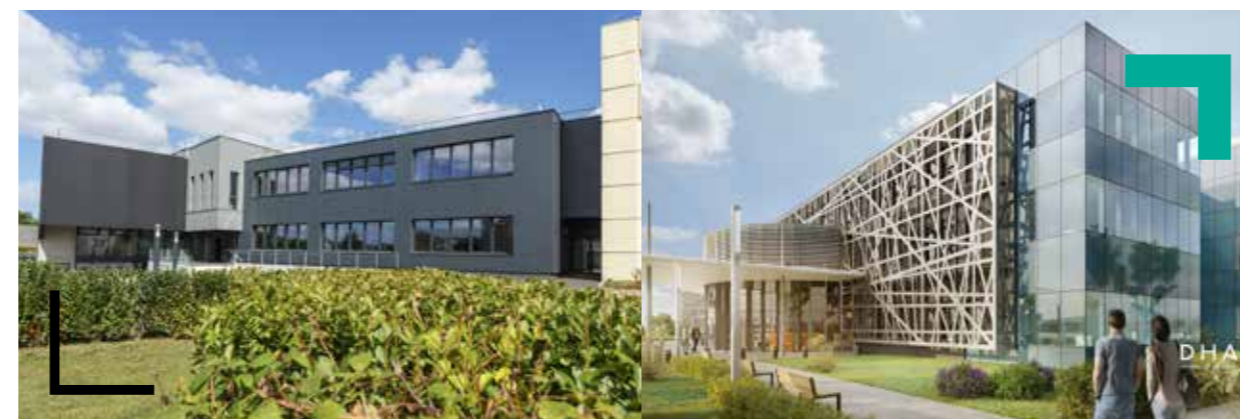
CESI se développe à Caen

Nos 20 parcours métiers sont diplômants et donnent lieu à délivrance d'une certification professionnelle enregistrée au RNCP*, reconnue par l'État et par les entreprises.