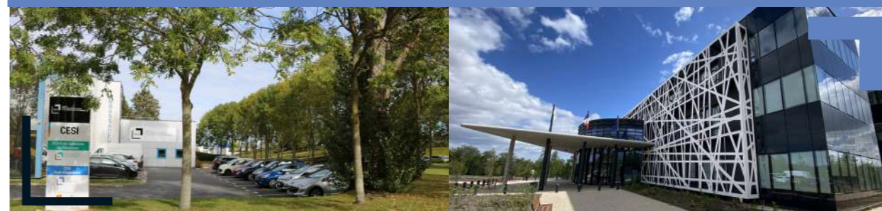
CESI Caen Campus EPOPEA